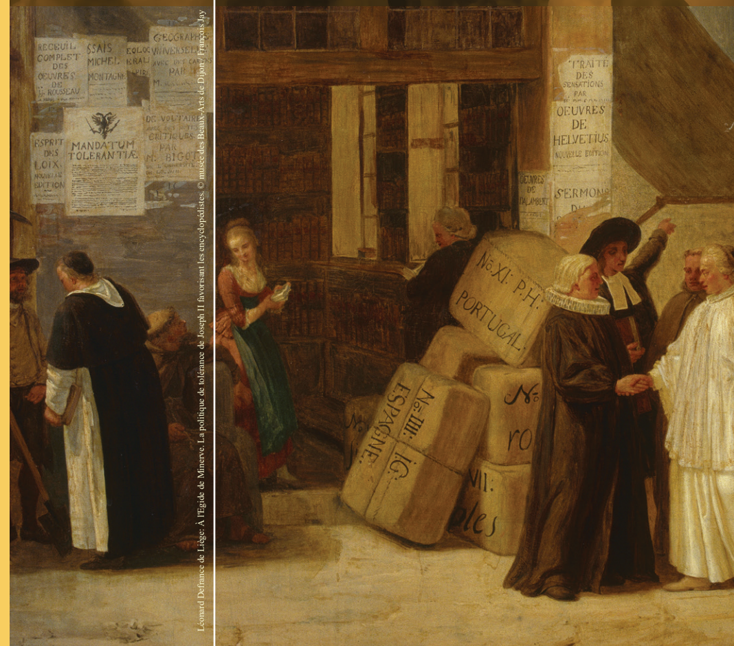
Leonard Defrance de Liège: À l'Égide de Minerve. La politique de tolérance de Joseph II favorisant les encyclopédistes.