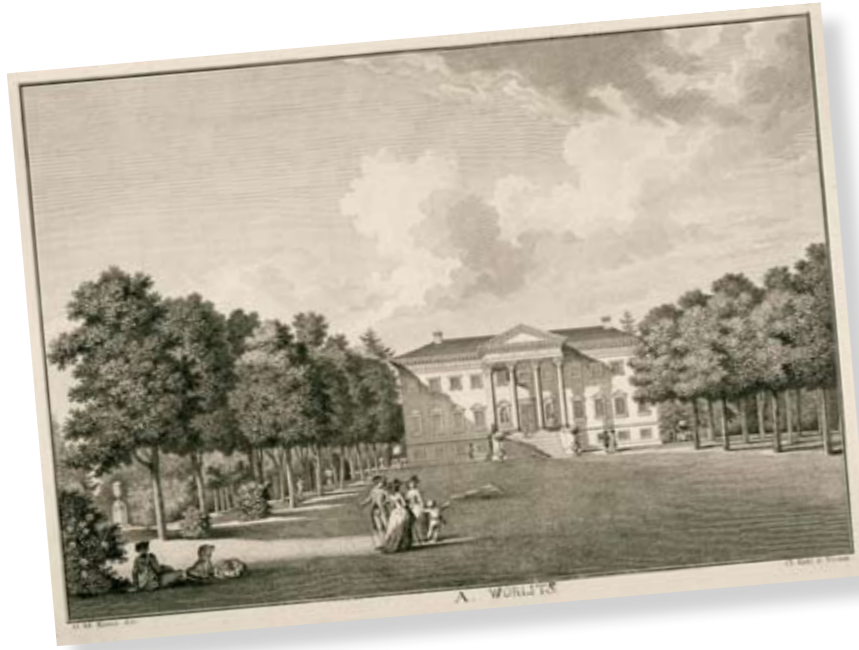
Titel: Das Schloß zu Wörlitz. Aquaretta von Karl Kunz, 1797.